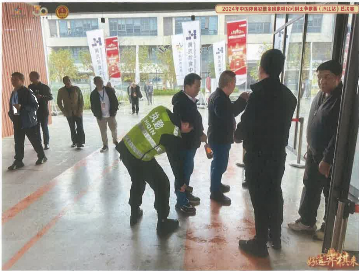
工作人员：主要负责接待和引导前来参加比赛的人员